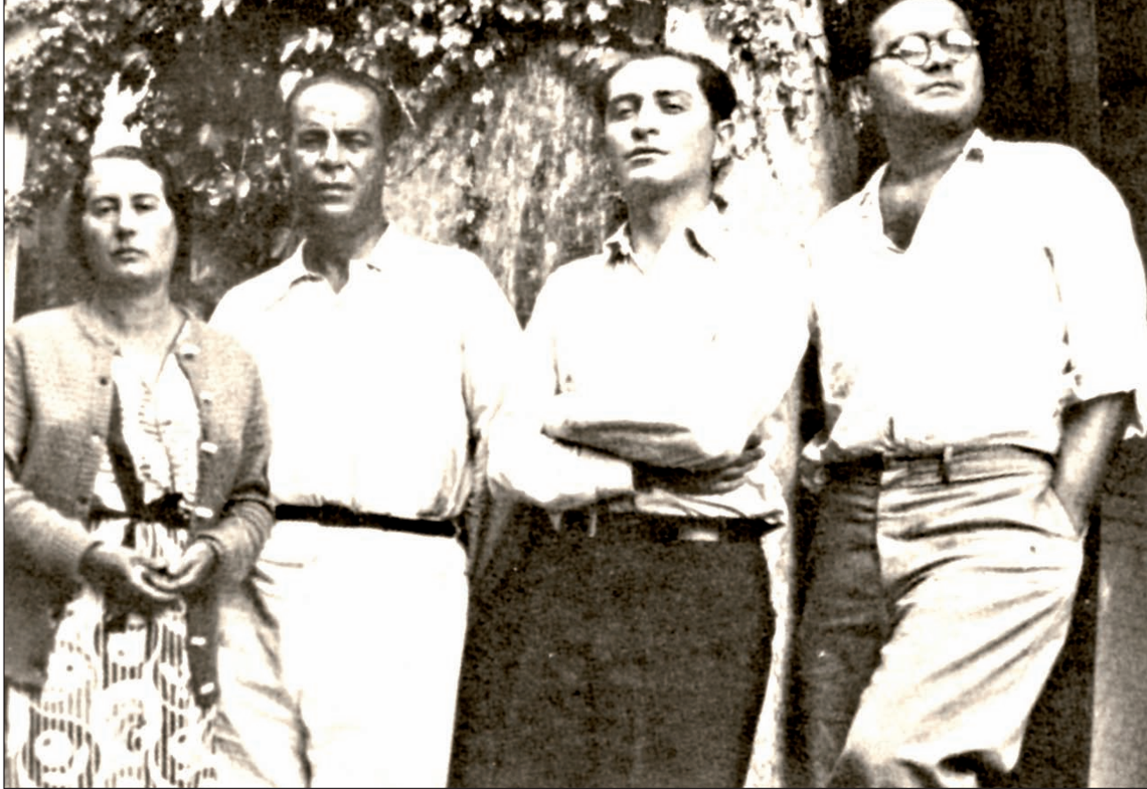
Teotiste Arocha, Rómulo Gallegos, Andrés Iduarte e Gonzalo Barrios. Beluso, 1935

falar con aqueles homes rudos do mar e con algúns deles establecerá amizade.