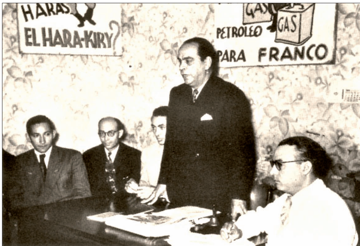
Intervención de Rómulo Gallegos nun acto antifranquista en Venezuela

vez en compañía de Maruja Mallo. Coma sempre, frecuentaba os faladoiros cos amigos da aldea, que se xuntaban no bar de Estévez. O tema obrigado, entre cunca e cunca de viño do país, eran os rumores de alzamento militar.