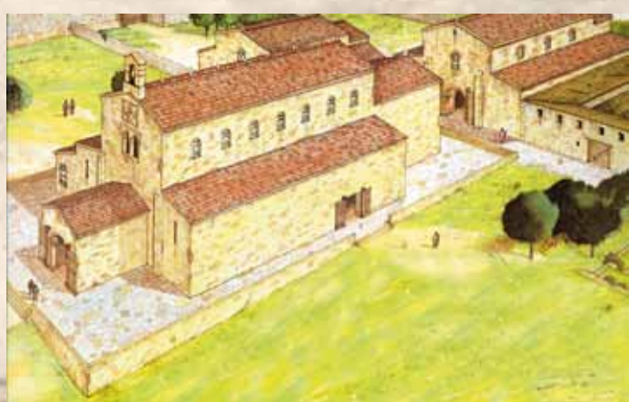
Recreación da basílica construída por Afonso III no ano 896. Debuxo de Fernando Aznar (Xerais, 1990)

No ano 997 produciuse o famoso ataque de Almanzor, que culminou coa destrución da cidade.