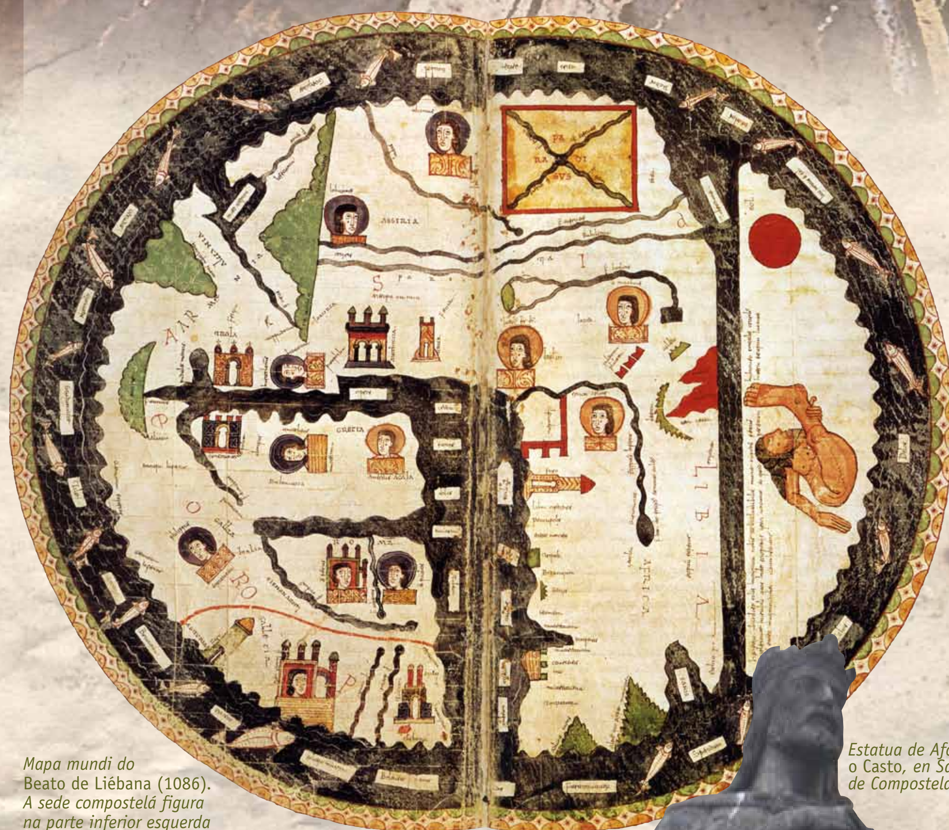
Mapa mundi do Beato de Liébana (1086). A sede compostelá figura na parte inferior esquerda