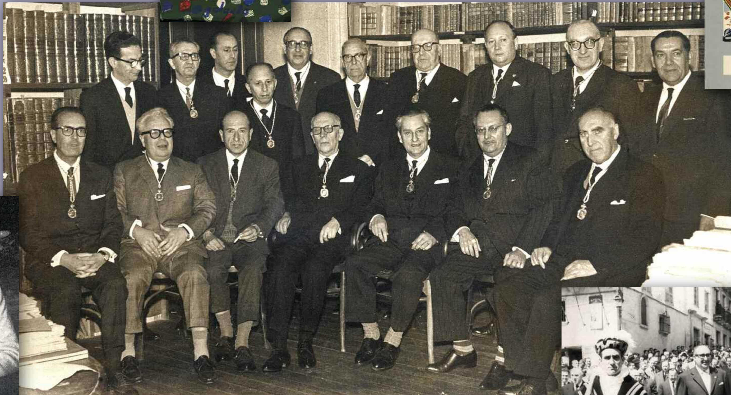
En Mondoñedo, o día do seu ingreso na Real Academia Galega

O libro de san Cibrán, O Ciprianillo , é unha das máis famosas guías de tesouros agochados